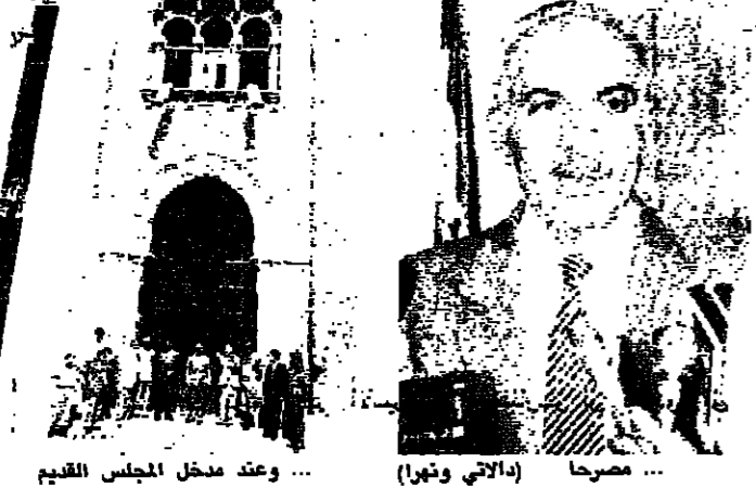
... وعقد مغل المجلس القديم

يعقد الرئيس السيد حسين علي ان تنعقد جلسة مناقشة القوانين التعديلات الدستورية الثالثة، وفي ضوء عودة رئيس الحكومة سنجري بالنيابة عن الرئيس الى بيروت، في جلسة الثلاثاء، اما الاعداد فينسفر الآن حتى يوم الثلاثاء المقبل لجلسة التعديلات الدستورية التي تعرفون. سئل، قبل الكلام عن تصليب جلسة الثلاثاء، هل هناك خطر على عدم استكمال النصاب؟